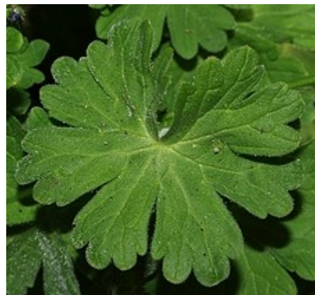
A – ERODIUM