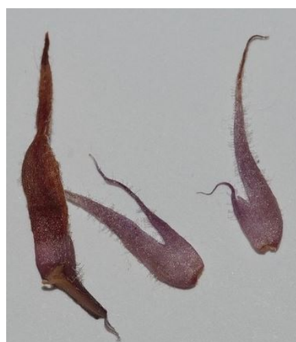
Calice très profondément fendu