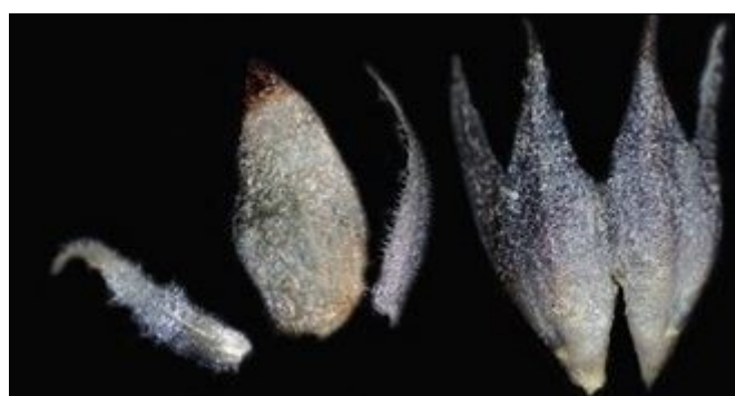
calice à sépales demi fendus