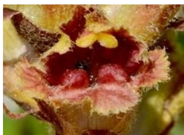
1 seule bractée florale ventrale

6- corolle à face interne toujours rouge foncé brillant, tube jaune teinté de rouge ; parasite diverses fabacées ..... ..... Orobanche grêle – Orobanche gracilis